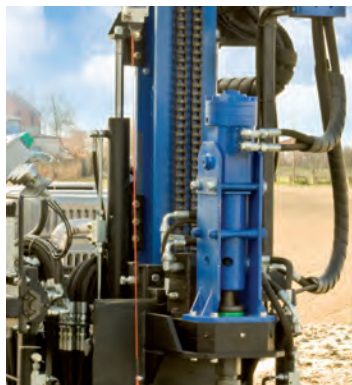
Particolare rotoperforatore a 2 motori e antenna idraulica allungabile (+2200 mm).

Hydraulic hammer with 2 motors and jib (+2200 mm)