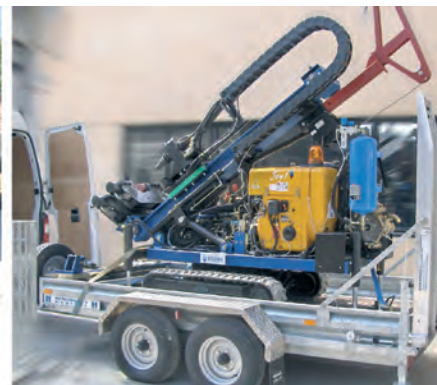
Le dimensioni compatte della perforatrice JOY 1 consentono di trasportarla con un carrello di piccole dimensioni

The small size of these drilling machines allows to move them on a little van