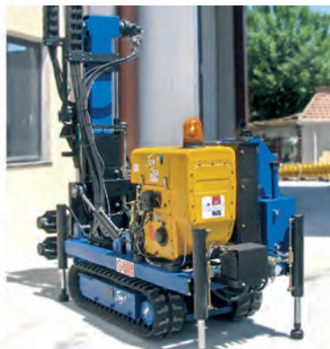
Vista posteriore JOY 1

Hydraulic hammer with 2 motors and jib (+2200 mm)