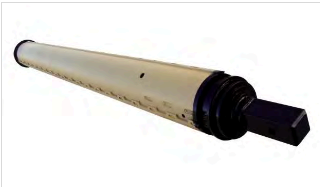
Asta rotonda a bloccaggio meccanico da 31 metri Kelly bar interlocking type (31 meters)